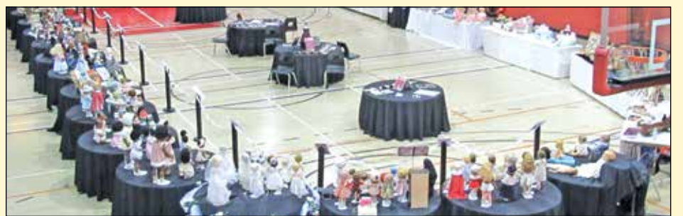
Au cours de la 5 e exposition de poupées et jouets et collections, le samedi et le dimanche 29 et 30 avril, le Cercle d'amateurs de poupées de Québec organise un centre d'accueil pour les poupées orphelines, peu importe leur état.

Par la suite, ils mettront ces poupées en adoption pour leur donner une nouvelle vie. Les vêtements et accessoires de poupées sont aussi appréciés. L'événement se déroulera au Séminaire Saint-François, 4900, chemin Saint-Félix, Saint-Augustin-de-Desmaures, les 2 et 30 avril de 10 h à 16 h. Le prix d'entrée est de 3 $, remis en don à la Fondation Saint-François. ■